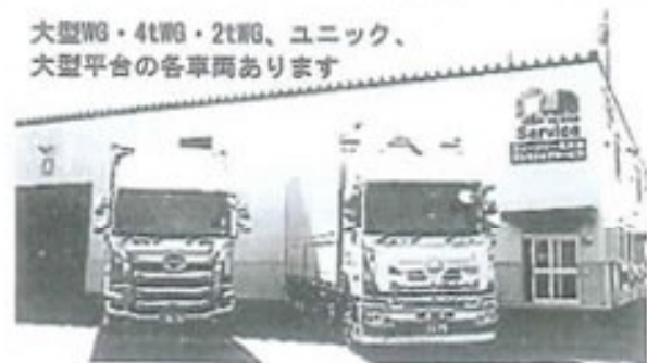
大型箱・4t箱・2t箱、ユニック、大型平台の各車両あります