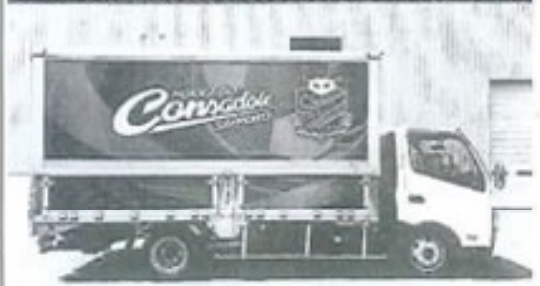
コンサドーレ様のトラック車両広告（稼働中）

★トラック車両広告がサービススタート！詳しくは上記HPをご覧ください ☆道内外の貨物運送、貸倉庫、トラック広告のご用命は当社までご相談下さい！